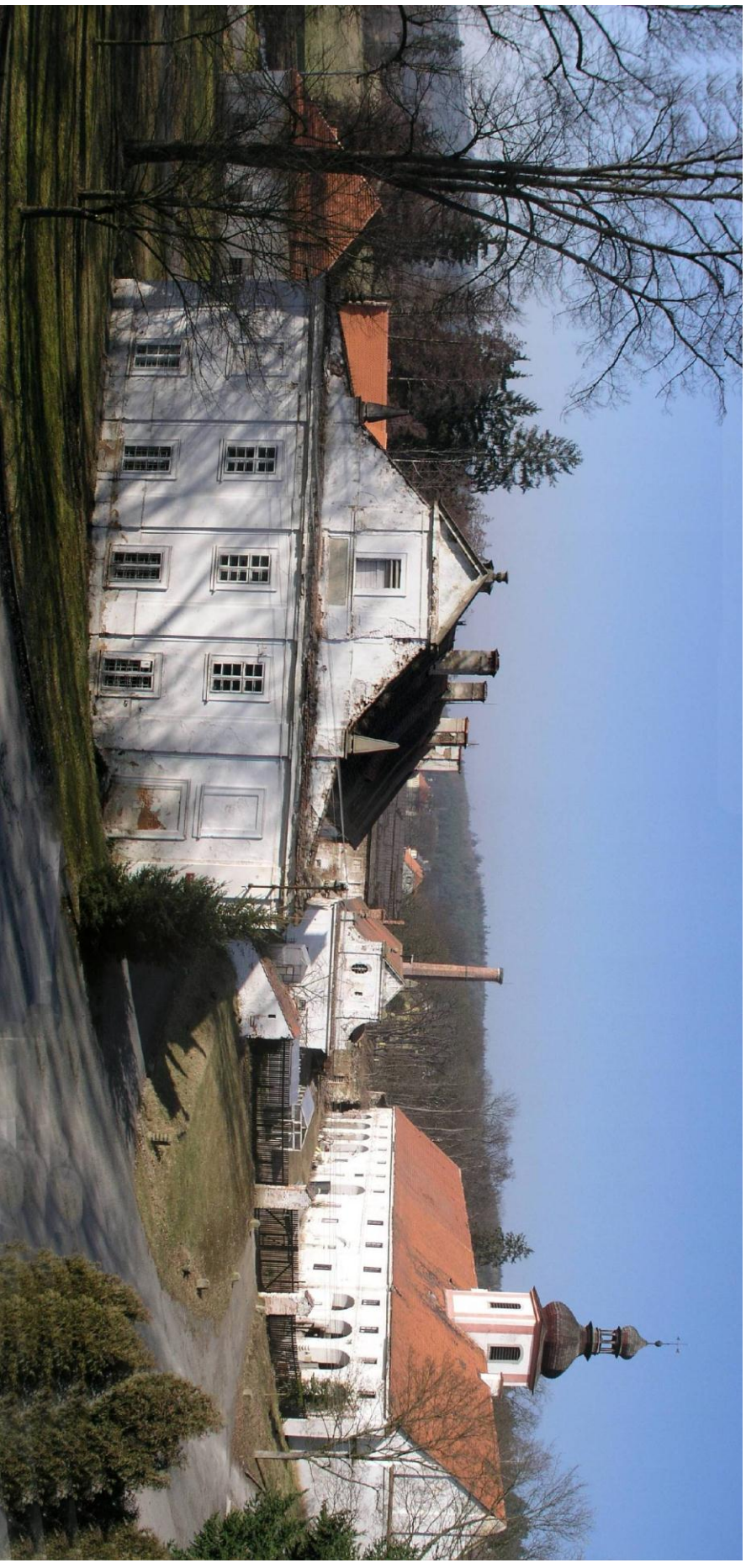
Centrum stavitelského dědictví v Plasích Areál hospodářského dvora (II. etapa projektu)