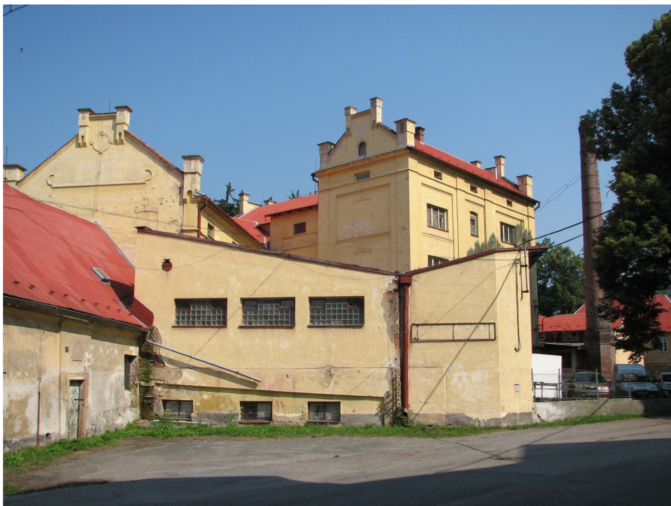
Centrum stavitelského dědictví v Plasích Areál pivovaru (I. etapa projektu)