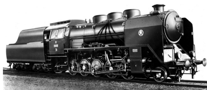
Lokomotiva 534.03, 1946